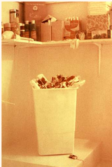
Menstruation Room, Judy Chicago

Souvenirs de Womanhouse 1972, extrait d'un entretien avec Judy Chicago.